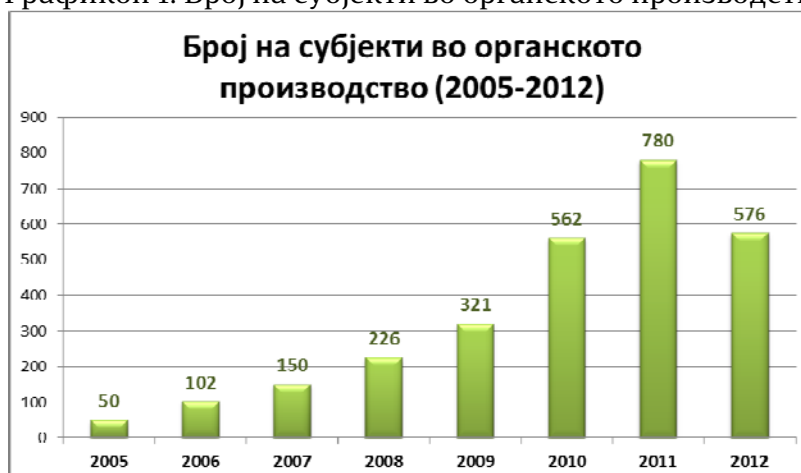
Графикон 1: Број на субјекти во органското производство